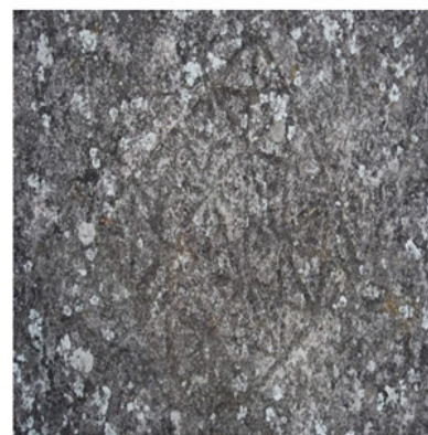
c. Petroglifo "Las Estrellas"

Figura 2. Recursos turísticos ubicados en el Piedra del Palco petroglifos "El espiral y las Estrellas".