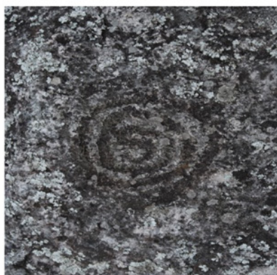
b. Petroglifo "El espiral"