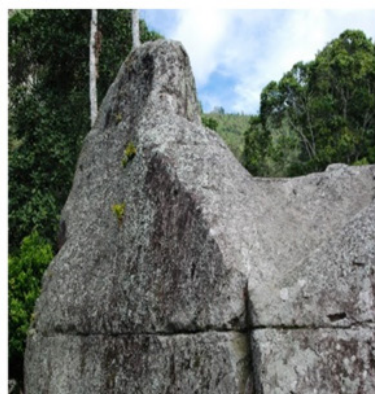
a. Piedra del Palco