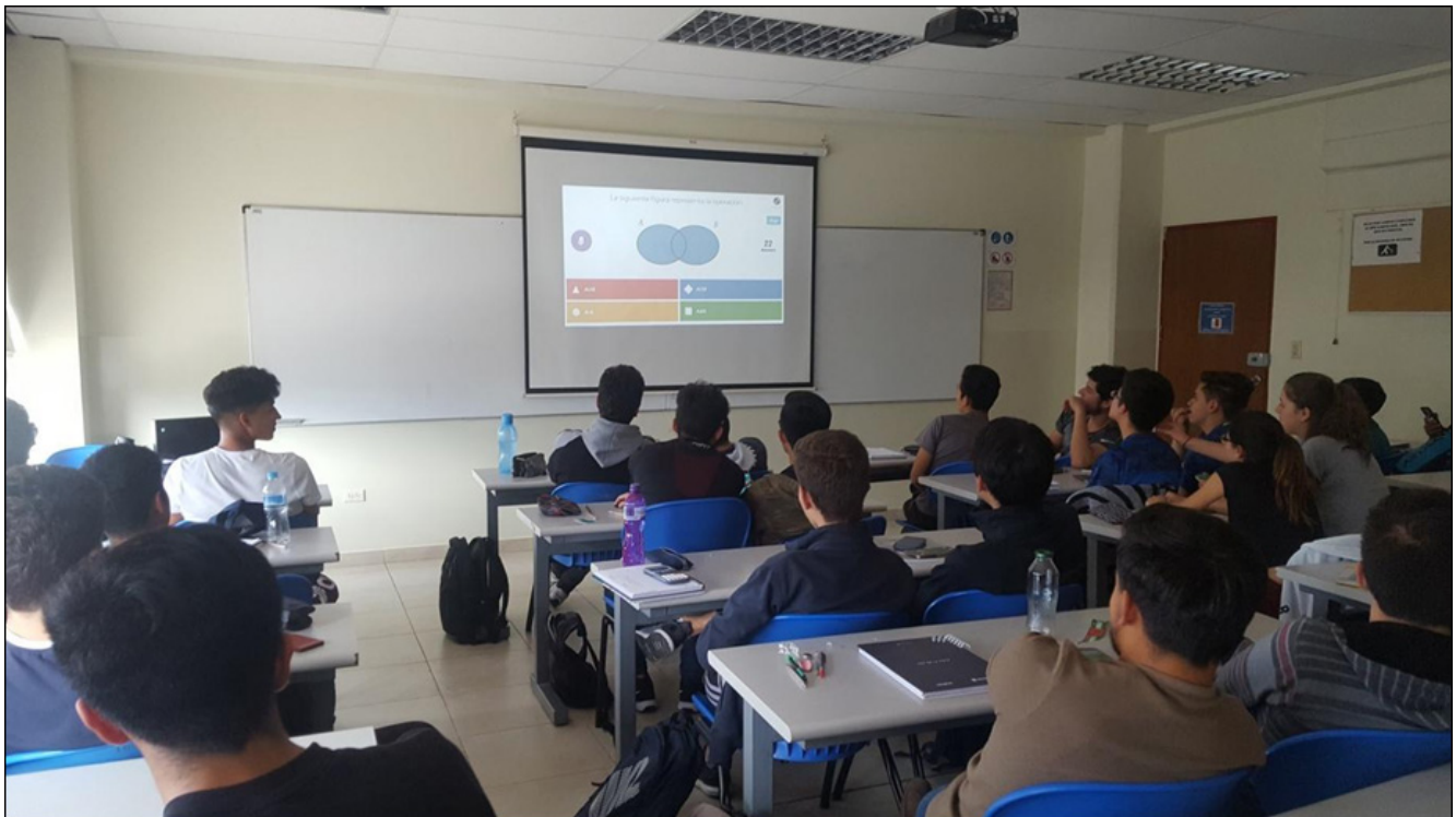
Figura 3. Desarrollo de la actividad por parte de los estudiantes del curso de Matemática Discreta, en el aula, haciendo uso de Kahoot, proyector y pizarra.