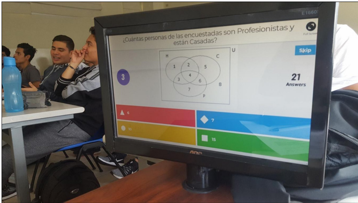
Figura 2. Ejemplo de la estructura de una de las preguntas del cuestionario aplicado sobre teoría de conjuntos en Kahoot.