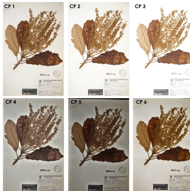
Figura 1. Muestra fotográfica de Clethra mexicana analizada con los seis potenciales protocolos implementados en el proceso de digitación de especies arbóreas en condiciones de herbario en Costa Rica.