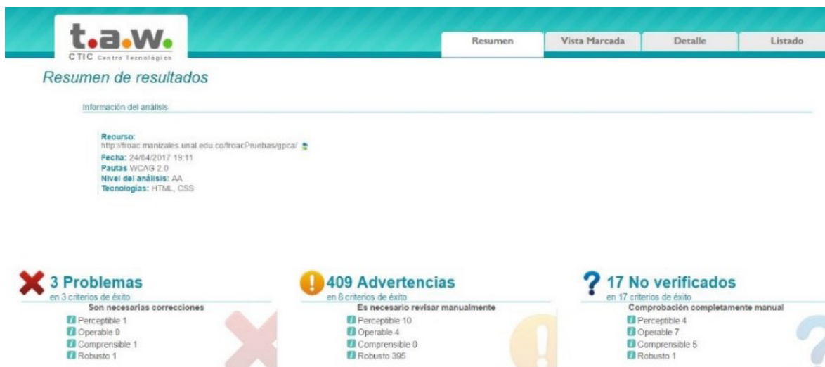
Figura 6. Evaluación de accesibilidad de GPCA usando el validador T.A.W.