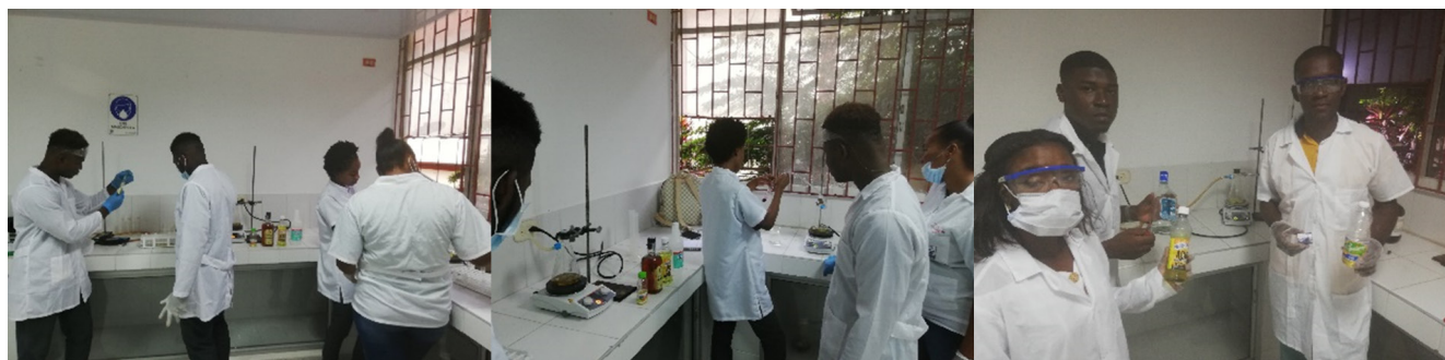
Figura 1. Montaje de obtención de eteno

Las etapas de esta estrategia metodológica permiten la posibilidad de que los estudiantes en su proceso de aprendizaje sean conscientes del por qué, del para qué, del con qué y del cómo se procede en cada una de las actividades relacionadas con el desarrollo de las prácticas de laboratorio, con el propósito de que se apropien de las competencias inherentes a la investigación.