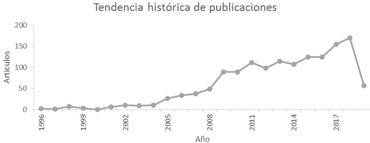
Figura 1. Tendencia histórica de las publicaciones en la temática