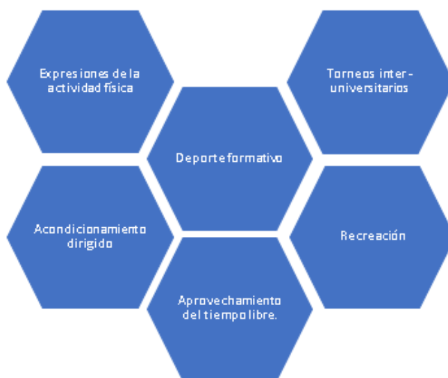
Ilustración N° 2. Servicios y actividades de deportes ofrecidas por bienestar en las IES.

Esto se materializa en el número de servicios prestados por la unidad a los diferentes estamentos de la comunidad universitaria, evidenciando que el deporte universitario es una manifestación del deporte, sin embargo, en las instituciones se desarrolla bajo el modelo del deporte “representativo” determinado por indicadores como, la practica formativa y recreativa de las poblaciones de estudiantes, docentes y funcionarios en las disciplinas deportivas ofrecidas por la institución, la competencia y participación en justas deportivas internas y externas de carácter local, regional y nacional; es decir se promueve espacios para la recreación y la formación deportiva complementando la formación académica, sin embargo, se necesita que el proceso sea orientado hacia el perfeccionamiento de las cualidades y condiciones físico-técnicas de deportistas que hacen parte de los niveles superiores desarrollados en el deporte de alto rendimiento.