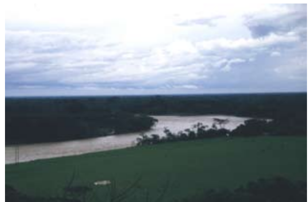
Figura 1. Panorámica del río Humea en el municipio de Medina (Cundinamarca). Castro 2002.

Si se pretende tener éxito en la planeación, diseño y posterior construcción de un sistema de abastecimiento de agua potable de una comunidad, es importante analizar cómo se realizará el aprovechamiento de los recursos hídricos; es indispensable tener claridad acerca de cuáles son los aspectos que fundamentales se deben considerar, que seguramente serán retos que se tendrán que estudiar cuidadosamente, afrontar y vencer, para posteriormente poder formular una política de aprovechamiento de recursos hídricos en el abastecimiento de agua potable de una comunidad. En la figura 1 se observa el panorama del río Humea en su recorrido por el municipio de Medina (Cundinamarca); se aprecia que no se respeta la ronda del río, con su caudal permanente y zonas aledañas aprovechadas con pasto para ganadería.