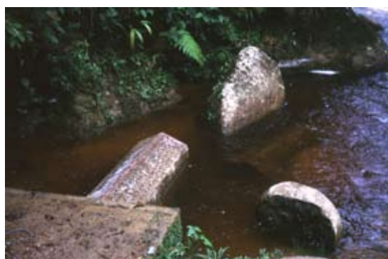
Figura 4. Bocatoma sobre el río Guarapas para el acueducto de Palestina (Huila)

específico; en la figura 4 se puede observar la bocatoma lateral que sobre el río Guarapas se construyó para abastecer de agua potable a la población de Palestina (Huila). Analizando el caso tema de este artículo, se debe entender que cuando se va a iniciar la planeación o el diseño con éxito de un sistema de acueductos (caso específico de fuentes superficiales, ya que para fuentes subterráneas se deben realizar otras consideraciones), después de seleccionada la fuente de captación no sólo debe averiguarse si el caudal de diseño para el sistema es menor que el caudal mínimo de la fuente, sino que además es necesario tener en cuenta que se debe respetar un caudal que garantice el sostenimiento de los ecosistema,s considerando no sólo las especies que allí habitan sino también las que hacen tránsito.