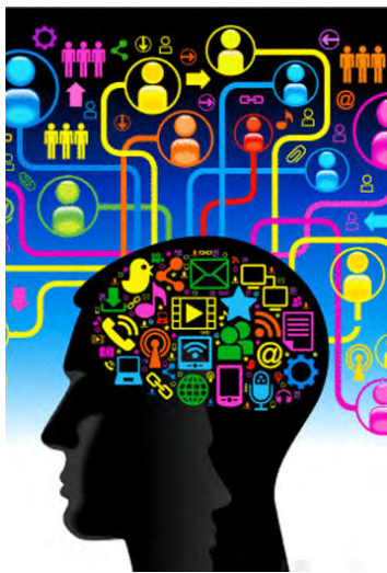
Figura 1. Infoxicación: cómo nos afecta la sobredosis informativa de Internet

Esta sobrecarga de información puede afectar a una organización en la productividad de sus empleados, puesto que hace que no sepan qué camino seguir a la hora de resolver un problema o una situación particular, lo cual produce inestabilidad, inseguridad, desmotivación y en muchos casos toma de decisiones erróneas.