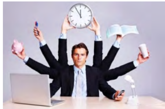
Figura 3. ¿El tiempo no te alcanza? 5 tips para combatir la sobrecarga laboral

es infoxicación, puesto que no sabe diferenciar espacios para asimilar y procesar esta información.