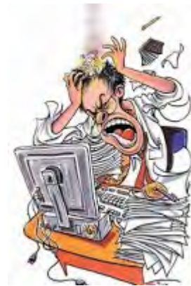
Figura 2. Infoxicación.