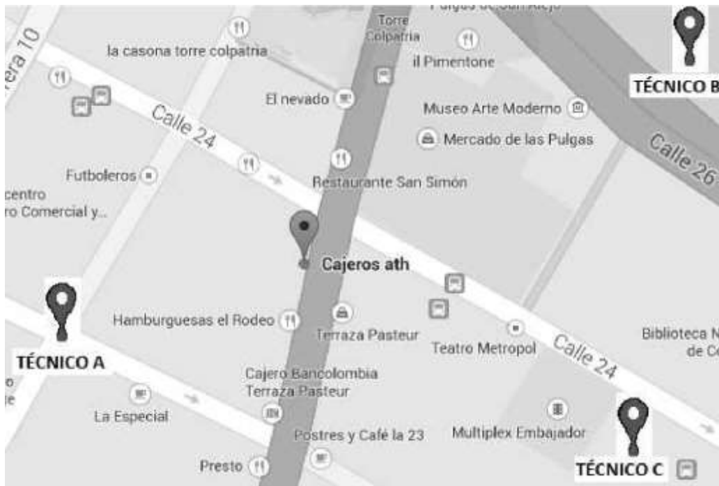
Figura 1. Posibles ubicaciones de personal técnico respecto a un cajero a automático.

Para poder usar la tecnología de posicionamiento global GPS se debe pensar en la plataforma móvil, ya que en la actualidad es de uso común los celulares inteligentes, a los cuales se les puede instalar una variedad de aplicaciones.