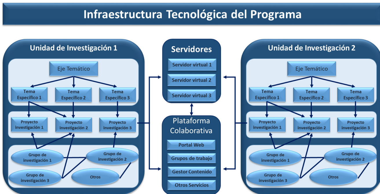
Figura 2. Estructura de las unidades de investigación.

La realización de los proyectos de investigación permite el desarrollo de productos y generación de nuevo conocimiento. Los productos relacionados con material didáctico basados en tecnología informática como simuladores, juegos, micromundos, laboratorios virtuales, cursos virtuales, sistemas de tutoría virtual, repositorios de objetos virtuales, entre otros, quedarán montados en los servidores virtuales para que sean utilizados y retroalimentados por la población. Los documentos de investigación podrán ser publicados a través de los portales de cada proyecto o la plataforma colaborativa que permite