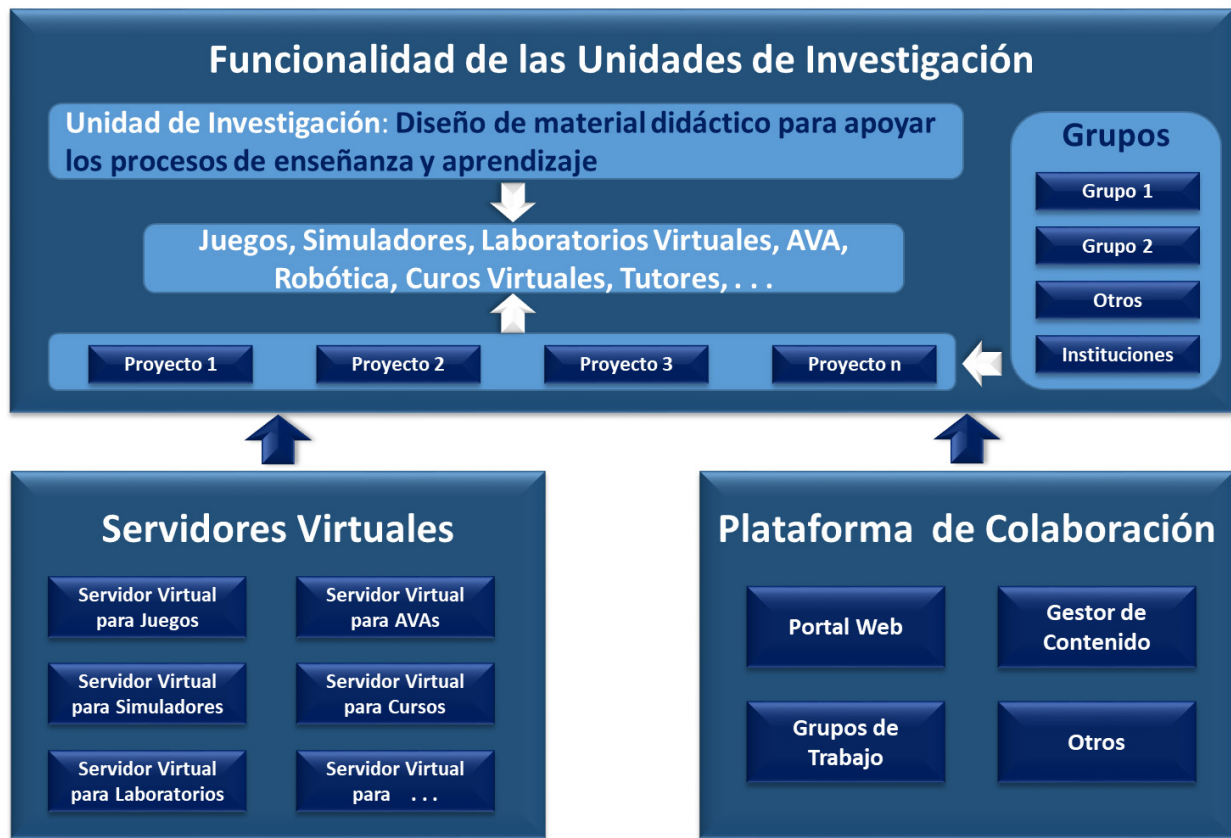
Figura 4. Funcionalidad de las unidades de investigación.