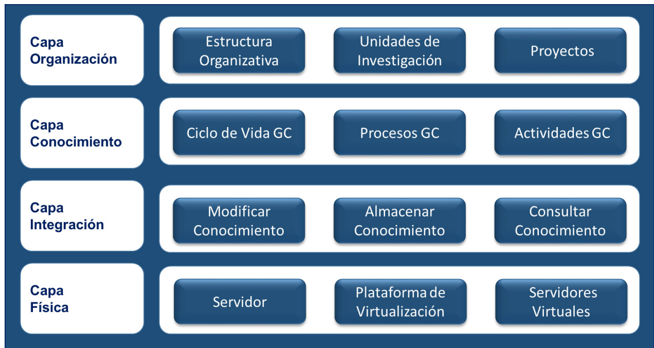
Figura 5. FGC con componentes del programa.