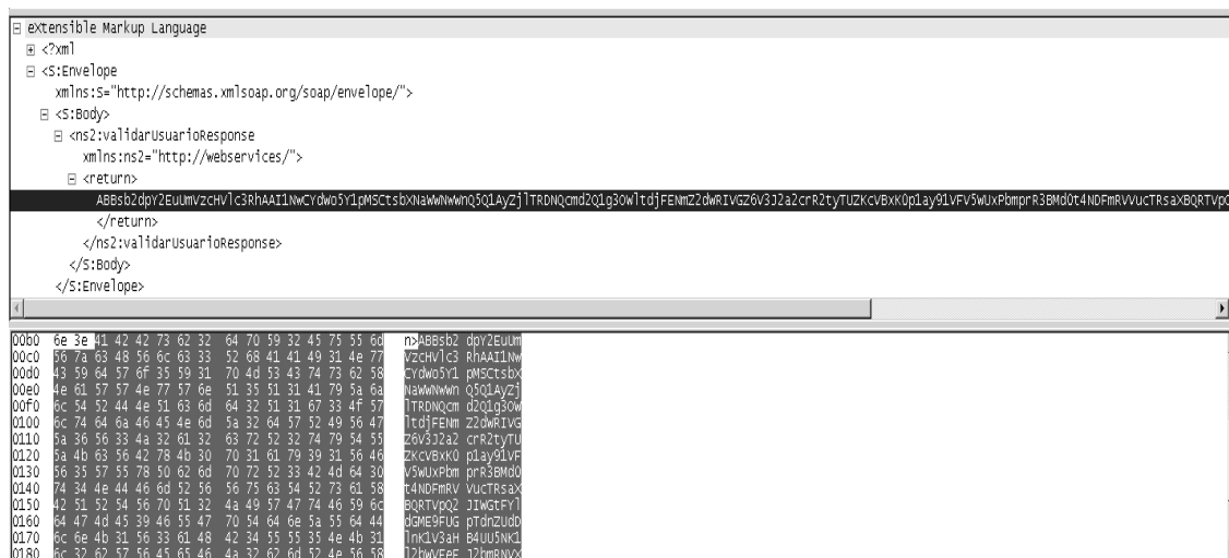
Figura 2. Traza validar usuario - Respuesta

terfaz de red. Las figuras 1 y 2, visualizan la información cifrada de la solicitud que realiza la aplicación móvil al servicio web y la respuesta de esta solicitud. Cada imagen se encuentra dividida en dos paneles, el primer panel muestra la información contenida en el paquete, como el encabezado y el cuerpo