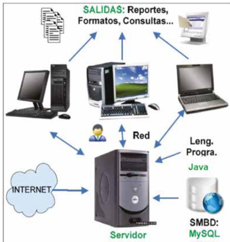
Figura 2. Diagrama de arquitectura del sistema propuesto