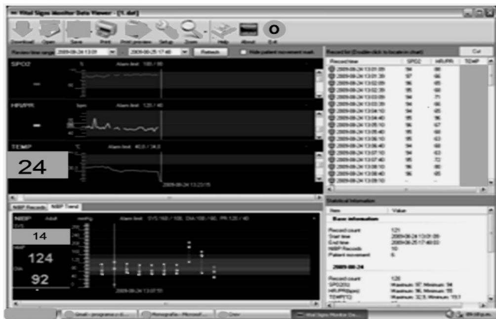
Figura 4. Visualización de resultados.

El diseño original desarrollado en sobre el que se inicio el también fue alojado en este hosting como www.sael.isgreat.org . Este hosting sirve a manera de disco duro, pero con una ubicación específica en Internet, y sobre el cual se instalan todas las aplicaciones pertinentes, lo que permite, como ya se dijo, almacenar información, imágenes, video, o cualquier contenido accesible vía web.