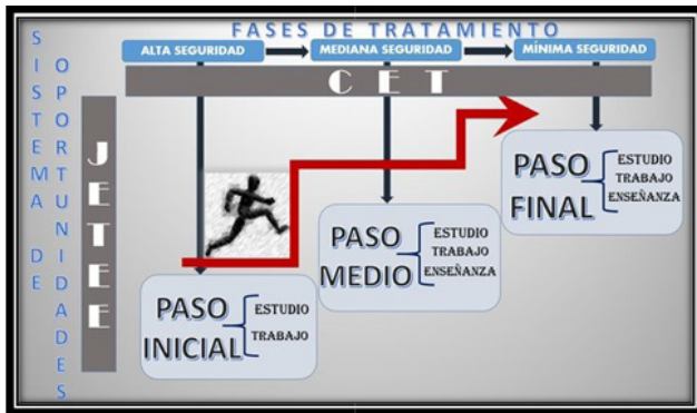
Figura 1. Tratamiento progresivo del interno.

la Junta de Evaluación Estudio y Enseñanza (Jete), cada vez que un interno decide voluntariamente acceder a una actividad válida de redención en cualquiera de las modalidades (enseñanza, estudio o trabajo).