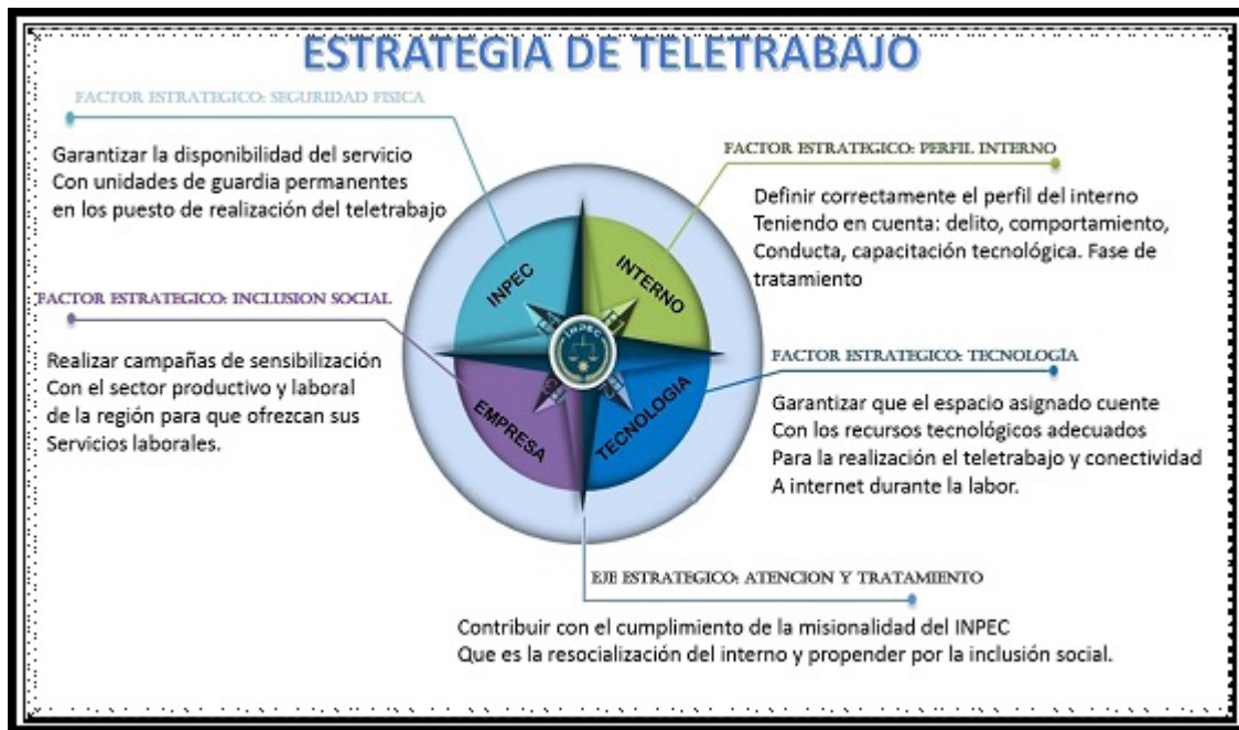
Figura 3. Estrategia de teletrabajo para EP Heliconias.